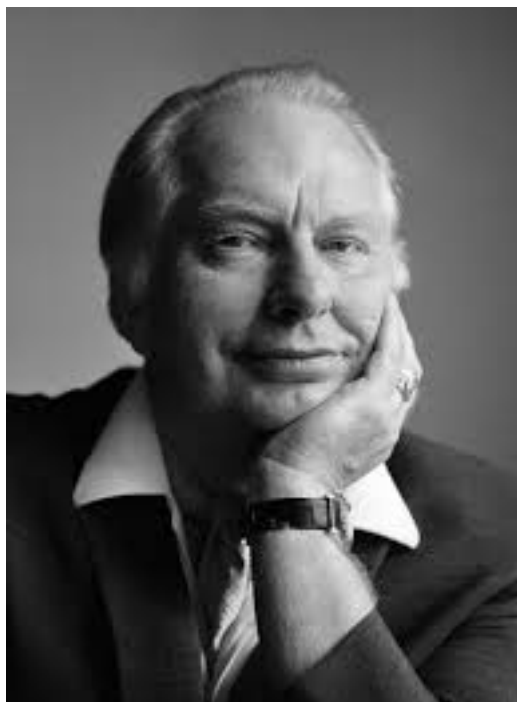
L. Ron Hubbard

L. Ron Hubbard scoprì che i residui di droghe lasciati nel corpo possono avere effetto sul proprio pensiero per anni, quindi sviluppò un metodo per eliminarli. Questa scoperta risultò essere essenziale per il recupero del tossicodipendente. Hubbard fornì anche i mezzi per riabilitare le capacità di una persona a comunicare e vivere una vita onesta. Queste ed altre scoperte umanitarie sono essenziali per rendere efficace il programma Narconon. L. Ron Hubbard è famoso anche per essere il fondatore della metodologia di Dianetics® e della filosofia religiosa di Scientology®. Il programma Narconon utilizza le opere del Sig. Hubbard, ma è completamente secolare (non religioso).